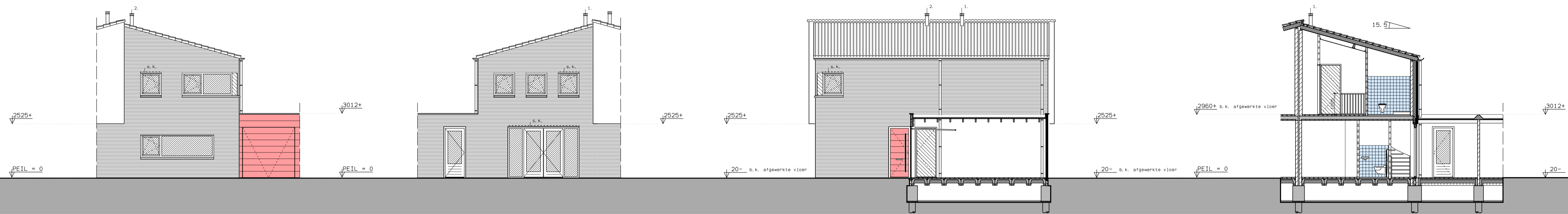
voorgevel achtergevel rechter zijgevel doorsnede A - A